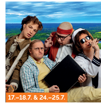
17.-18.7. & 24.-25.7.